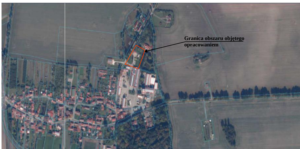
Ryc. 3. Teren objęty projektem miejscowego planu zagospodarowania przestrzennego na tle m. Lotyń