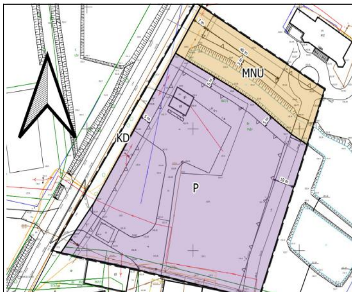
Ryc.1 Plan zagospodarowania przestrzennego „Lotyń – rejon ul. Polnej” - rysunek

Zasady modernizacji, rozbudowy i budowy systemów komunikacji polegają na: