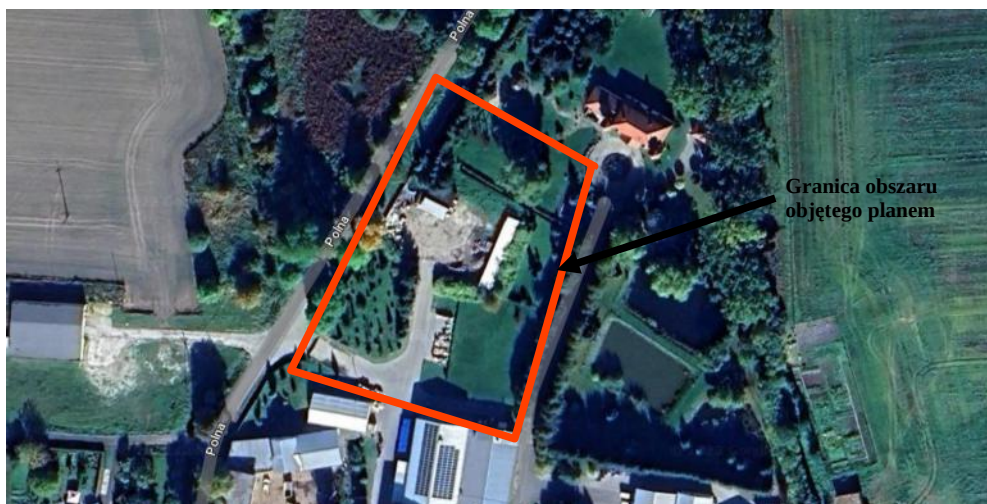
Ryc. 5. Teren objęty projektem zmiany planu zagospodarowania przestrzennego „Lotyń – rejon ul. Polnej” powstały w wyniku działalności gospodarczej człowieka

Analizowany obszar nie przedstawia wartości pod względem przyrodniczym. Bioróżnorodność florystyczna ekosystemu jest niewielka, roślinność w większości nie jest wartościowa z przyrodniczego punktu widzenia, a jej funkcja polega głównie na tworzeniu powierzchni biologicznie czynnej.