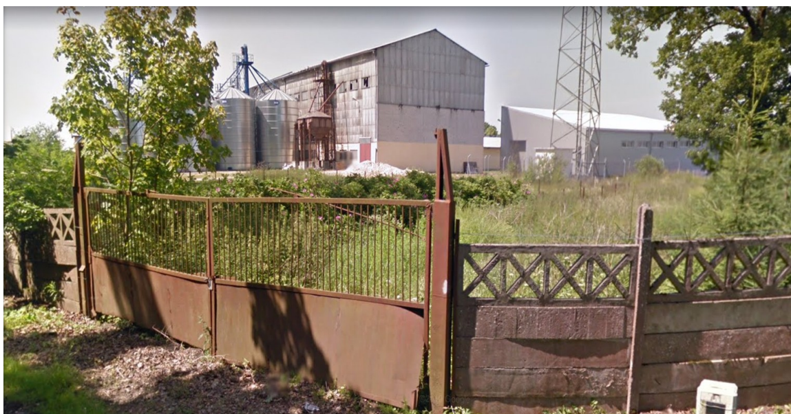
Ryc. 3. Widok na analizowany obszar od strony ul. Pocztowej.

Nie stwierdzono na obszarze projektowanego Planu gatunków roślin objętych ochroną prawną.